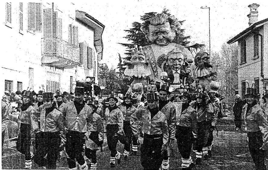
Nella foto grande il carro dei Barabet favorito per la vittoria finale, sopra immagini dalla prima sfilata

Un altro gruppo che suona dal vivo, i Chin 8, e la Carica dei 101 della Cascina Aquilone anticipano il secondo gruppo ospite della prima sfilata: il gruppo di cornamuse bergamasche della Baghet band. Arrivano